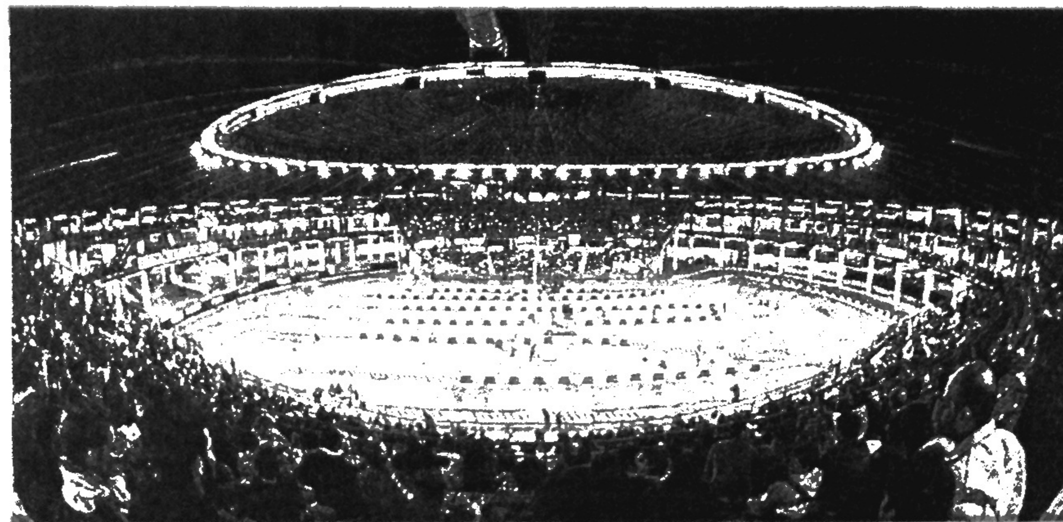
Le luci del Palasport pronti ad accendersi per la prova spettacolo del Rally Lanterna

In abbinata anche l'Appennino Una prova dedicata a Sinatra