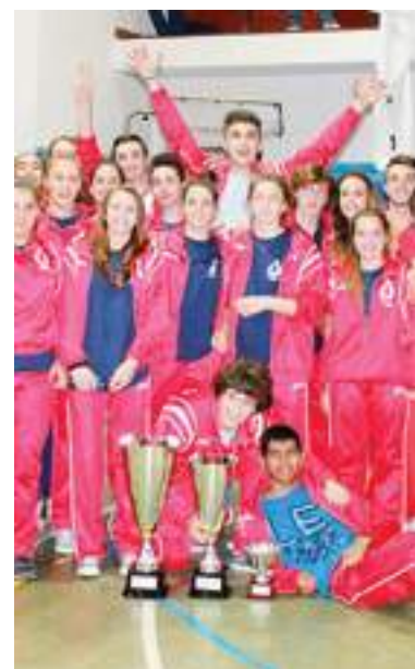
La delegazione genovese

D Femminile. Playoff: Celle Varazze-Casarza Ligure 3-1, Admo Lavagna-Lunezia Team Volley 3-0, C.P.O. Ortonovo-Pgs Auxilium 3-0. Celle Varazze e Admo Lavagna promosse in serie C. Ortonovo e Pgs Auxilium alla bella. Playout: Canaletto-Cogoleto 1-3, Loano-Spezia Elettrosistemi 3-0. Classifica: Cogoleto 27, Vallestura, Loano 23, Serteco Volley School 18, Spezia Elettrosistemi 12, Canaletto 11, Recco, Sanremo 6.