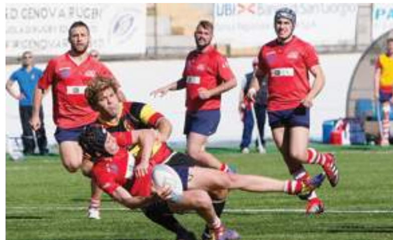
Il Cus Genova in una fase d'attacco