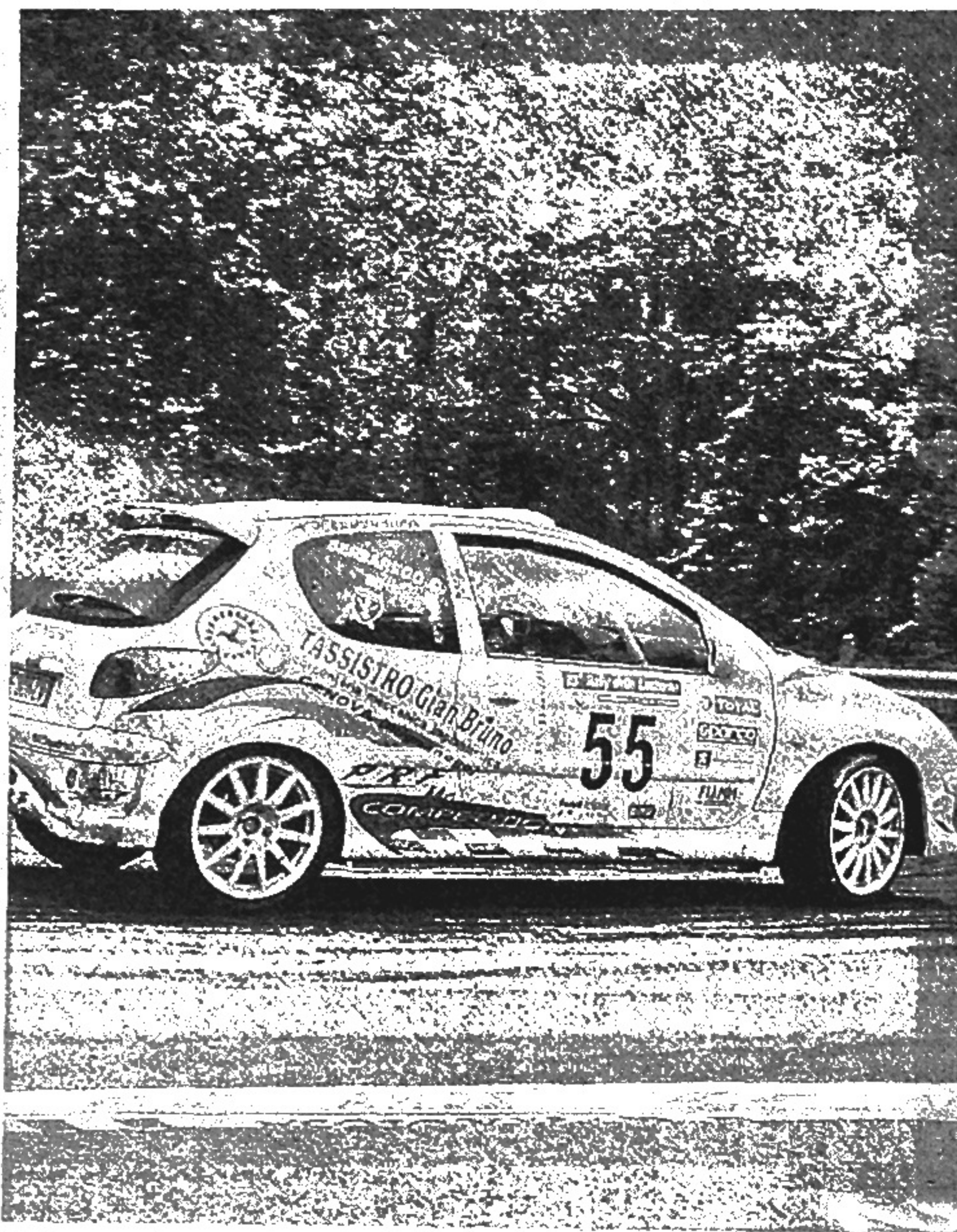
Tuo-Sessarego sulle strade del Lanterna in una foto d'archivio

dove anche i piloti locali, con costi ridotti, potranno dimostrare le loro doti e fare eventuali raffronti con i big del momento.